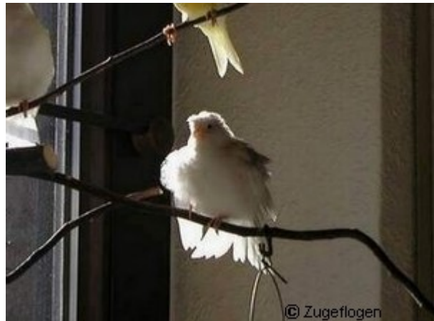
Kanarienvogel beim Sonnenbad

Sitzstangen sollten so angebracht sein, dass sich die Vögel so positionieren können, dass ihr Kopf bei 35-70 Watt Leistung 10 cm oder bei 150-250 Watt 20 cm von der Lichtquelle entfernt ist. Unter diesen Sonnenspots zeigen die Vögel das gleiche Sonnenbadeverhalten (Federn und Flügel abspreizen, sich räkeln) wie in einem Sonnenfleck in der Natur. Jede tagaktive Vogelart nutzt solche Sonnenbademöglichkeiten gerne.