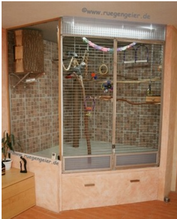
Papageienvoliere mit Beleuchtung

Was uns Menschen als hell erscheint, ist für Vögel und viele Terrarientiere alles andere als hell. Ein immer noch sehr präsenten Erbe unserer Waldaffenvorfahren ist unter anderem, dass unser menschliches Auge/Hirn-System Helligkeitskontraste übertreibt.