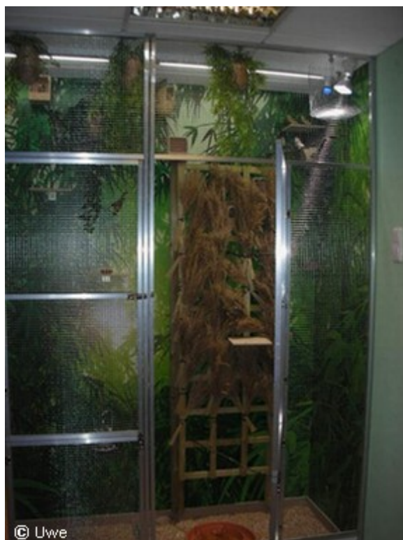
Prachtfinkenvoliere mit Beleuchtung

Bei einer 20 Watt-Energiesparlampe lassen sich hingegen vergleichsweise in 1m Abstand nur noch ca. 300 Lux an Lichtstärke messen und insgesamt bringt sie nur ca. 5 Watt Lichtleistung.