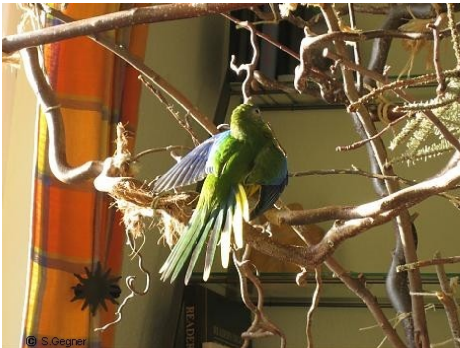
Schönsittich beim Sonnenbaden

Darüber hinaus sonnenbaden viele Vögel sehr gern, wobei sie je nach Art ihr Gefieder entsprechend aufstellen und ausbreiten.